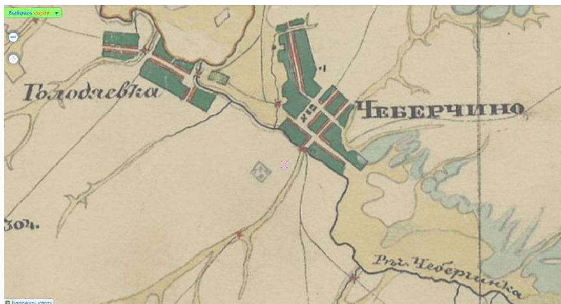
Рис. 1. Фрагмент карты Симбирской губернии А.И. Менде, 1861

На карте 1809 г. село, расположенное на бывшей Караульной горе, представляет раздробленную композицию, протянувшуюся четырьмя цепочками мелких элементов между речкой Чеберчинкой и прямым длинным порядком, обращенным на юго-запад. С севера эта улица переходит в дорогу на село Морга. Центр села Чеберчино – три участка, два прямоугольных и один шестиугольный, вероятно, с барскими усадебными и церковными постройками. Западнее села Чеберчино вдоль речки показана деревня Голодяево. На карте А.И. Менде 1861 г. планировка села более компактная, она повторяет рельеф местности, две длинные улицы изгибаются вдоль горизонталей, две прямые перпендикулярны склонам. На выделенном прямоугольнике располагаются церковный ансамбль и усадебные здания, спускающиеся по склону к речке Чеберчинке, южнее села находится кладбище. К селу подходят три дороги: с запада от деревни Голодяевки, с юга и севера.