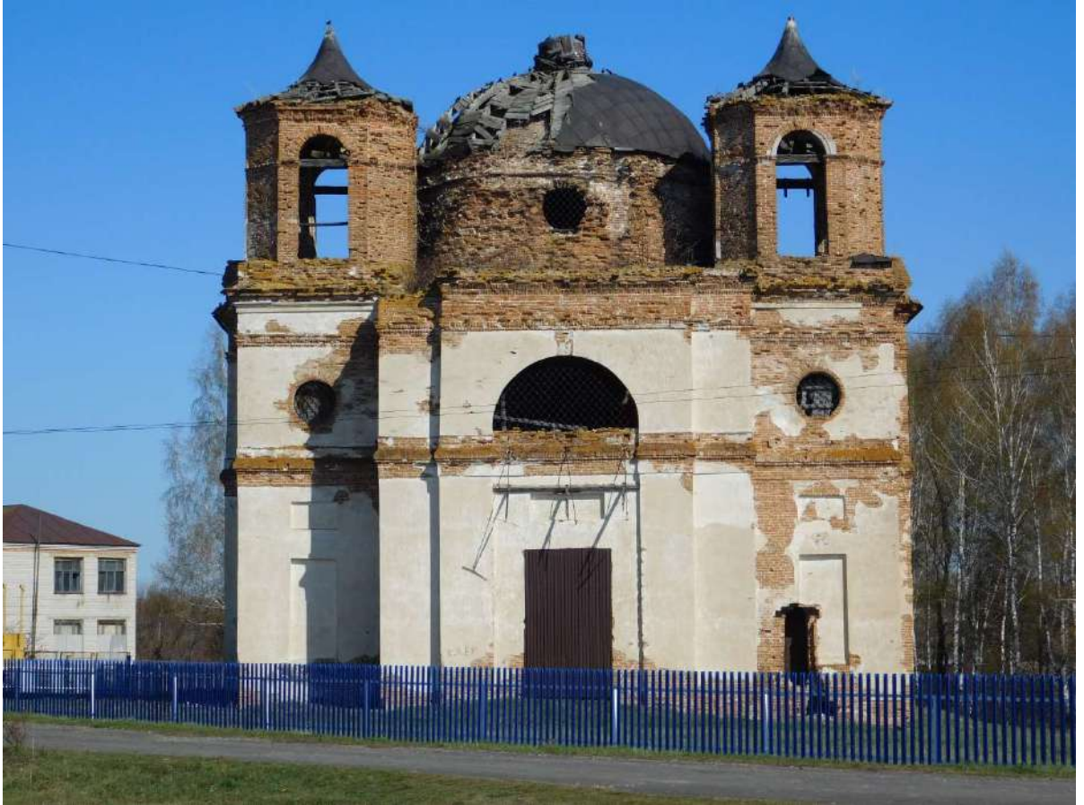
Рис. 4. Казанская церковь. Западный фасад. (2021)

круглыми окошками без наличников. Аналогичными четырьмя окошками прорезан барабан. Под проемами второго света по всему периметру проходит широкая тяга. Первый свет организован шестью большими прямоугольными проемами. Скупость декора, возможно, объясняется навыками местных строителей, которые не смогли воспроизвести все элементы проекта. Между тем, интерьер был богато украшен архитектурными деталями, лепниной и живописью.