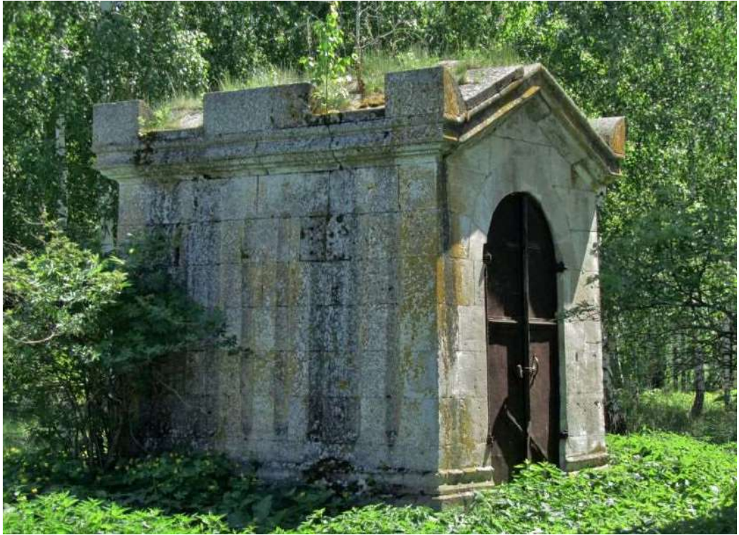
Рис. 5. Мавзолей. (2021)

Кирпичное здание Михайло-Архангельской церкви представляет вытянутый объем элементарной формы (размеры в плане 22,6×8,4 м), завершенный двускатной крышей. С западной стороны сделан небольшой притвор. Фасады имеют упрощенный декор (карниз, рустованные пилястры). Здание утратило завершение и было расширено с северной части.