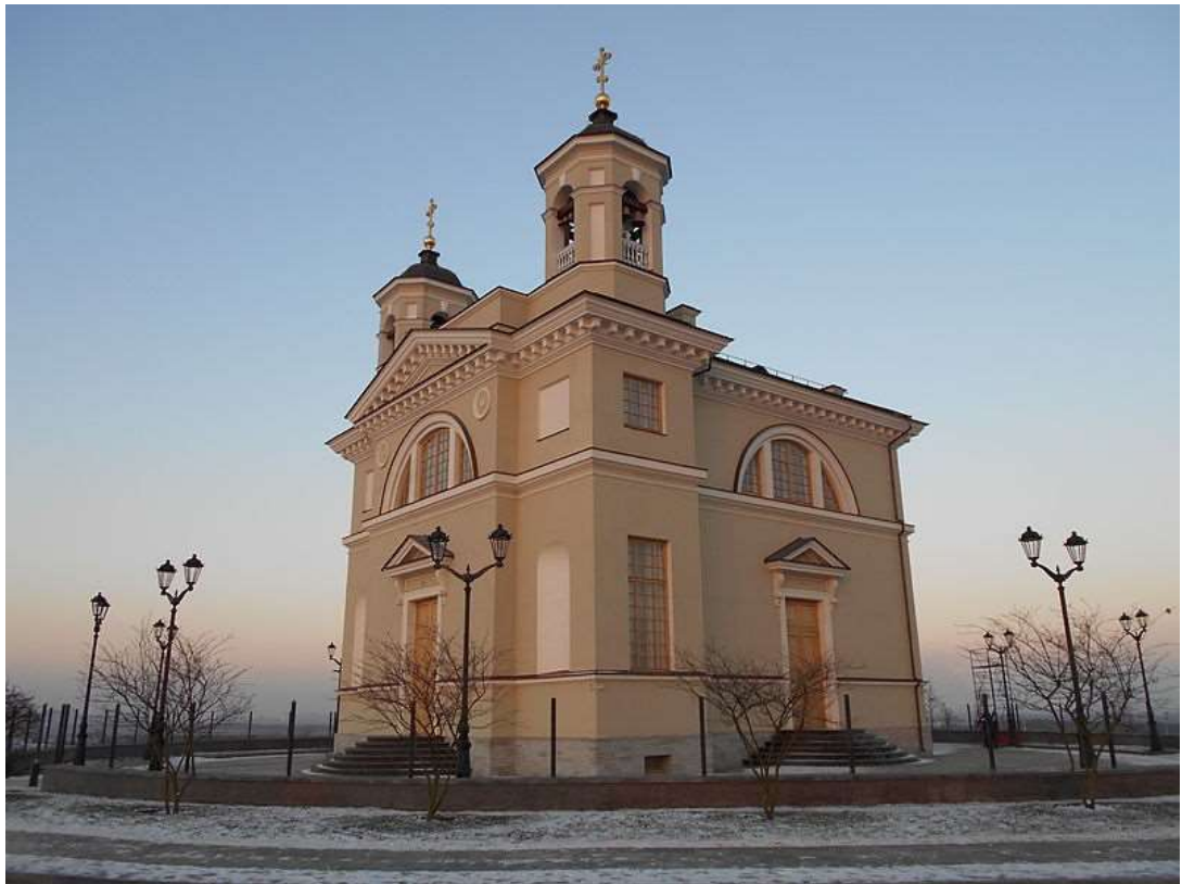
Рис.6. Смоленская церковь в Пулково. Источник:

Усадебные храмы такого типа были построены в дворцовых селах вокруг царской императорской резиденции. Смоленская церковь в Пулково строилась в 1782-1785 гг. по проекту Кваренги на выделенные императрицей казенные средства (в 1943 г. она была разрушена, а в 2016 г. в виде копии восстановлена на новом месте). Греческий крест плана является основанием куба, перекрытого цилиндрическим сводом на четырех пилонах, над сводом устроена четырехскатная крыша без купола. Западный фасад дополнен парой башен квадратного сечения (в первоначальном проекте башни были над четырьмя углами), в здании три входа (в первоначальном варианте западный фасад имел двухколонную дорическую лоджию), алтарь циркулярный [5].