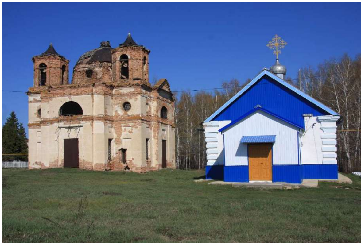
Рис. 8. Казанская и Михайловская церкви. Фото В.Б. Махаева (2021)

ресечении нескольких уличных осей поселения. Колокольни в перечисленных усадьбах призывались к церкви и главной улице, проходившей через центр поселения. Как была поставлена, например, колокольня в Пошехонье, видно на веерной планировке уездного города, сложившейся к началу XIX в. и образованной 8 радиальными улицами, сходящимися к площади. Колокольня построена по диагонали с древним собором, в 19 м от его северо-западного угла. На пятиглавие приземистого собора ориентированы две улицы веера, на высокую четырехъярусную колокольню 6 улиц веера.