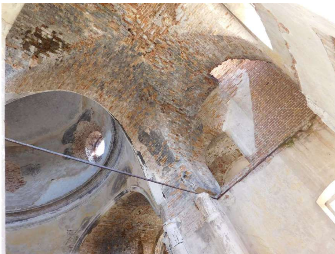
Рис. 7. Казанская церковь. Своды.

Создателями церковного ансамбля были сын и внук А.И. Румянцева. П.А. Румянцев заказал проект архитектору, но в конце жизни он удалился в свое малороссийское имение Ташань, где умер в одиночестве в 1796 г. (за два года до освящения чеберчинского храма). Заложил и построил этот храм его сын Н.П. Румянцев (1754-1826), крупный дипломат и коллекционер. Увековечивая самих себя, отец и сын назвали боковые приделы в честь положения вериг апостола Петра и во имя Николая Чудотворца.