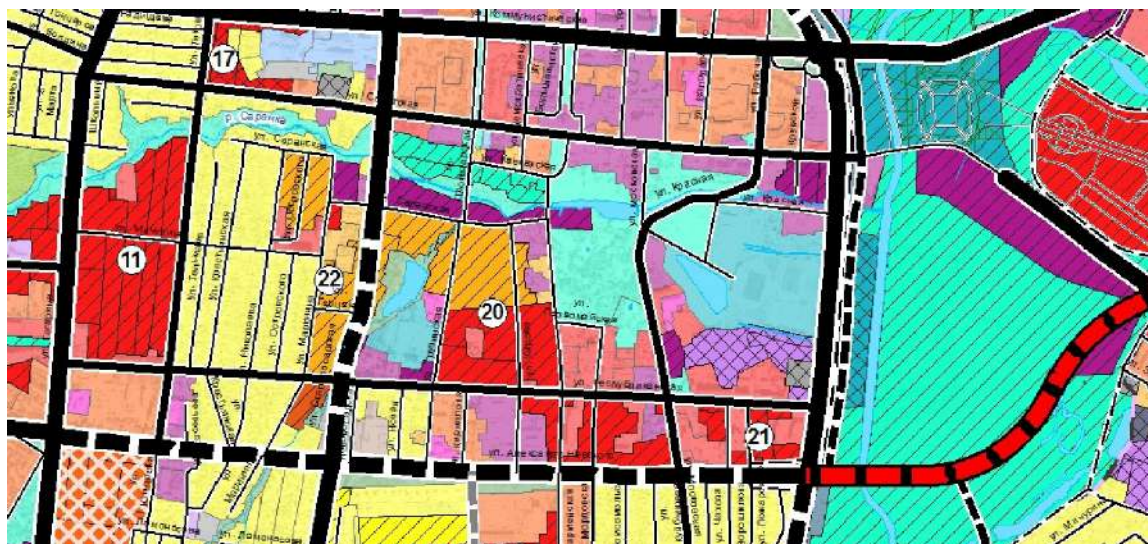
Рис. 3. Фрагмент схемы корректировки генерального плана Саранска (2013). Площадки нового жилищного строительства, под номером 20 – квартал с домом А.А. Мухина

В доме хранится более 50 живописных полотен в рамах и множество этюдов и набросков А.А. Мухина. Представляют ценность и сотни книг по искусству, составляющие библиотеку художника. В доме царит художественная аура, родственниками заботливо оберегается память о художнике А.А. Мухине, в целом можно сказать, что это один из немногих в Саранске жилых домов, где много десятилетий сохраняется образ жизни, предметная и духовно-эстетическая среда, представляющая одухотворенный мир художника. В 2020 г. на фасаде дома была установлена памятная доска.