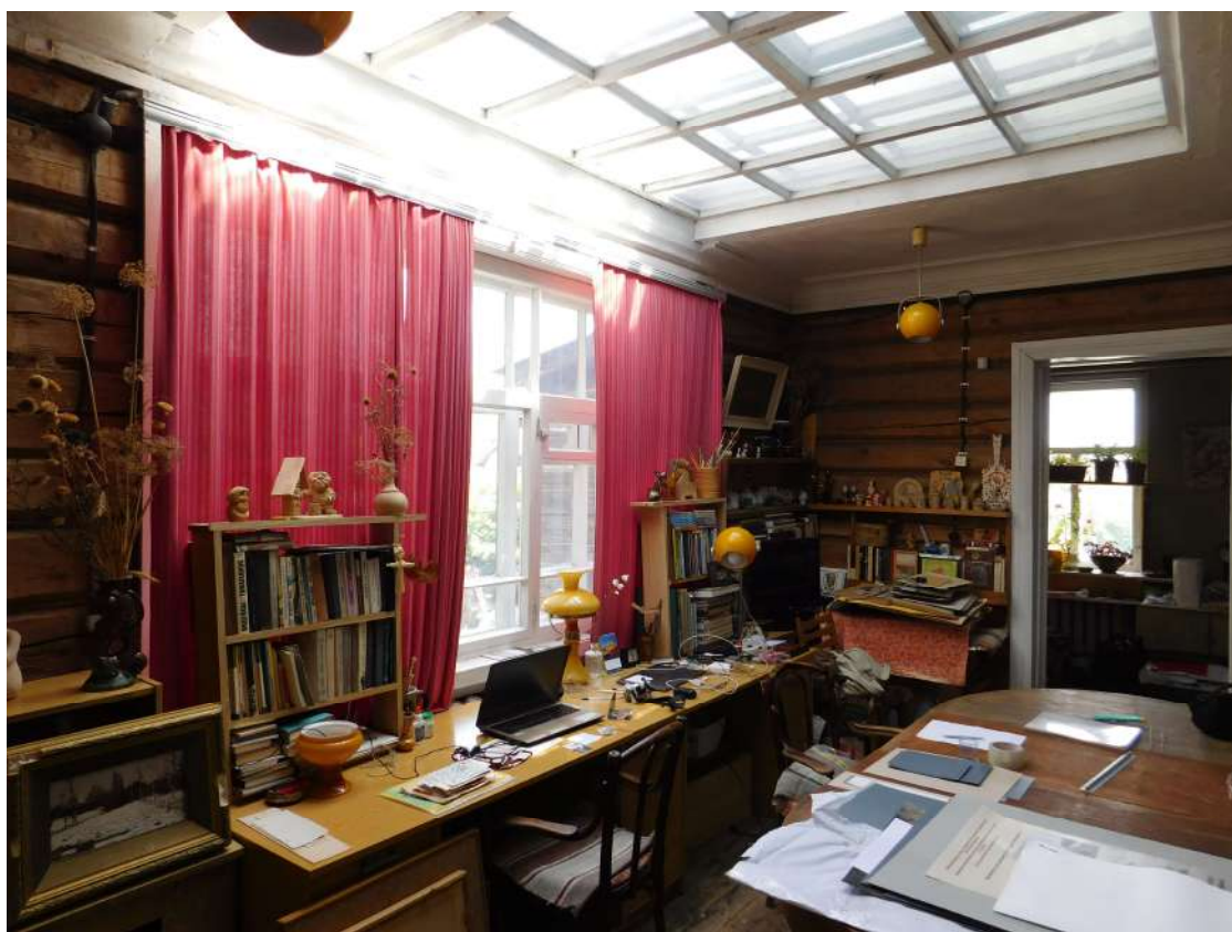
Рис. 2. Мастерская на втором этаже. Фото В.Б. Махаева (2019)

Небольшой сад связан с домом дворовым выходом из прихожей-коридора. В саду находится дровяной сарай, плодовые деревья и кустарники, цветники. Выложенная камнем дорожка огибает юго-восточный угол дома. Во дворе парковалась легковая машина (в 1960-1970-е гг. «Волга ГАЗ-21», в 1980-е гг. «Жигули»). Перед уличным фасадом А.А. Мухин высадил две березы (сохранилась одна) и кусты сирени, которые сегодня в летний период почти полностью закрывают фасад дома.