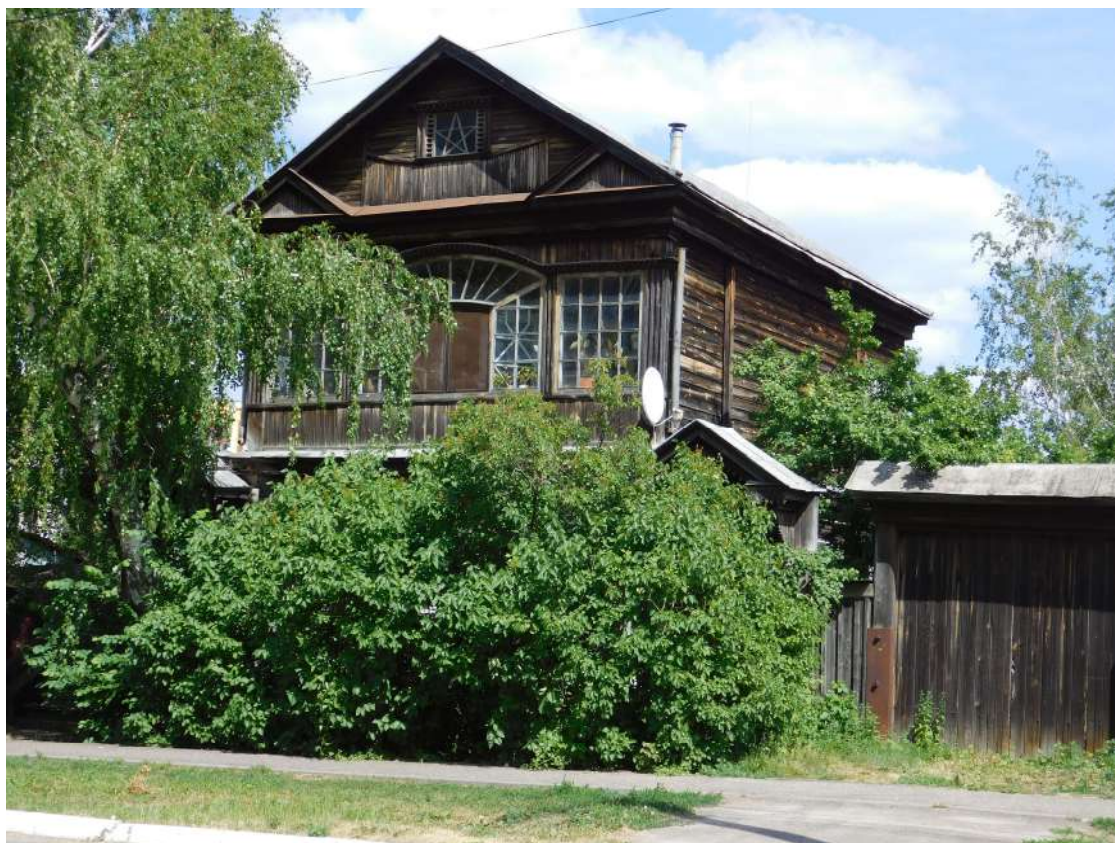
Рис. 2. Уличный фасад дома А.А. Мухина.

Усадебный участок располагается на восточной стороне улицы среди одноэтажной деревянной застройки, хорошо озелененной, главным фасадом дом А.А. Мухина обращен на запад. В 1972 г. на противоположной стороне улицы был построен по типовому проекту Дом пионеров и школьников. В 2000-е гг. на смежном участке была создана обширная спортивная зона.