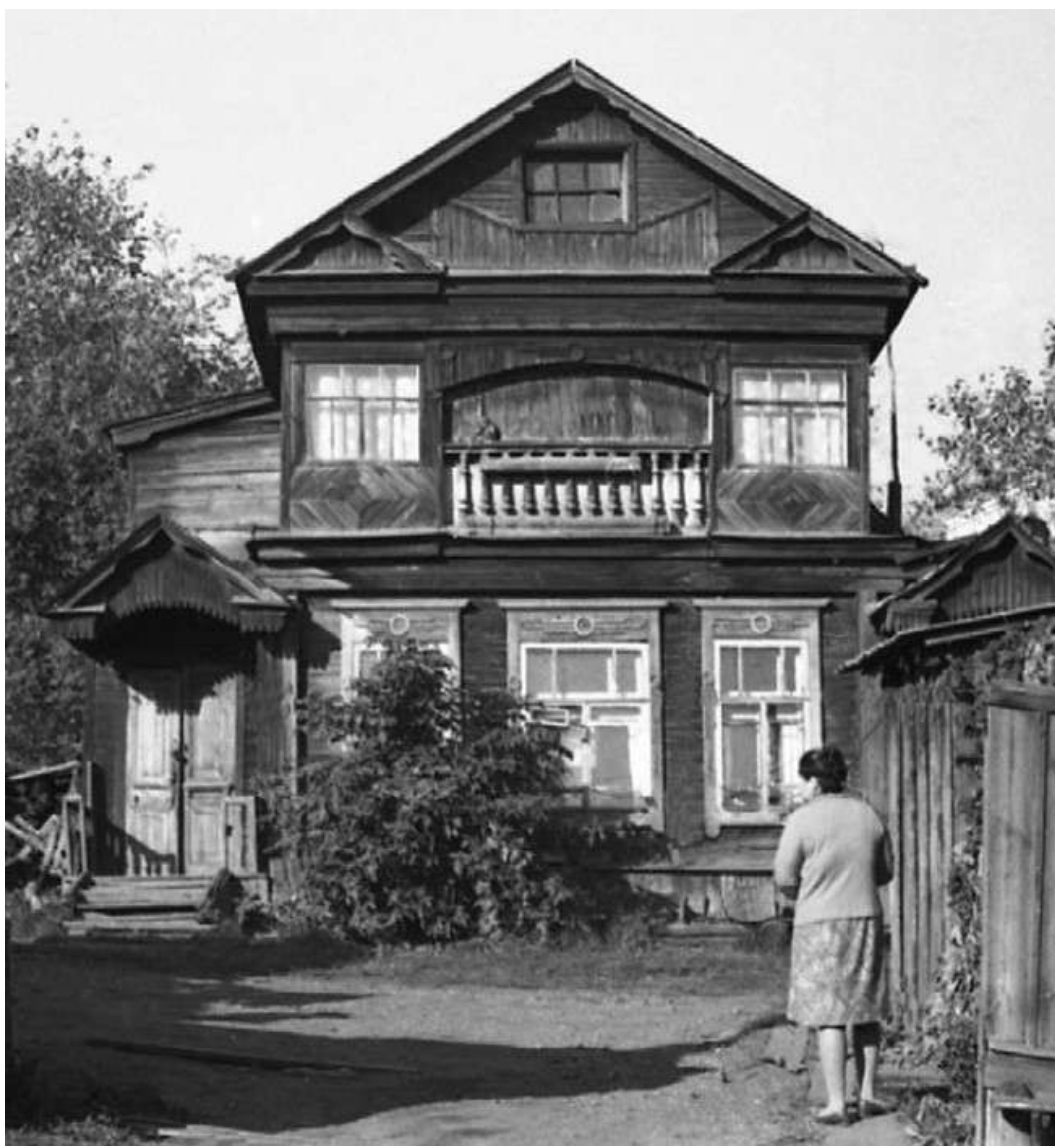
Рис. 1. Жилой дом на ул. Рабочей. (1960-е гг.)

История строительства здания. Дом в Саранске на ул. Грузинской, 34 был выстроен в 1955 г. на участке, принадлежавшем родственнице (сестре тестя А.А. Мухина), потомку саранских купцов. После сноса ветхой постройки за один летний сезон был возведен двухэтажный дом, и в начале ноября 1955 г. семья художника вселилась в него.