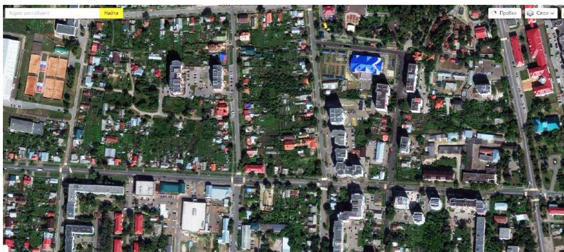
Рис. 4. Космическая фотография кварталов в границах ул. Республиканской, Саранской, Красноармейской и Грузинской (2021)

Градостроительная ситуация. Дом А.А. Мухина располагается в одной из самых проблемных селитебных зон города Саранска. До конца 1990-х гг. территория Центрального планировочного района южнее р. Саранки представляла усадебную